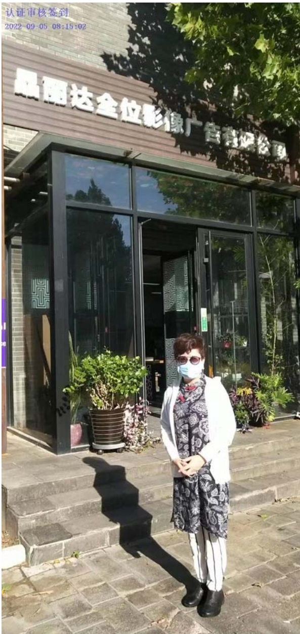
公司客户明显特征处